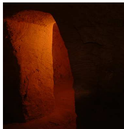
Rifugio Antiaereo

Obiettivo dell'incontro, oltre alla presentazione dei propri lavori su esplorazioni e scoperte, è quello di condividere idee e progetti e gettare le basi per una rete di attività territoriali condivise che possono riguardare tutte le attività svolte dai singoli gruppi (didattica, attività di protezione-prevenzione, ricerche sul territorio, comunicazione del mondo ipogeo etc. etc.).