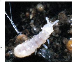
Deuteraphorura banii

La situazione del catasto regionale, dei dati catastali e la collaborazione con Regione e SSI.