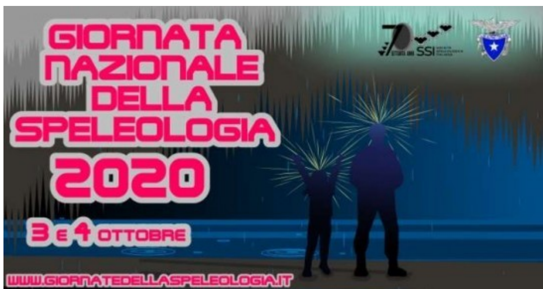
Giornate nazionali della Speleologia 2020

Il 3 e 4 ottobre 2020 si svolgeranno le Giornate Nazionali della Speleologia. Ecco il programma degli eventi, incontri, escursioni e mostre promossi in tutta Italia dal CAI e dalla Società Speleologica Italiana.