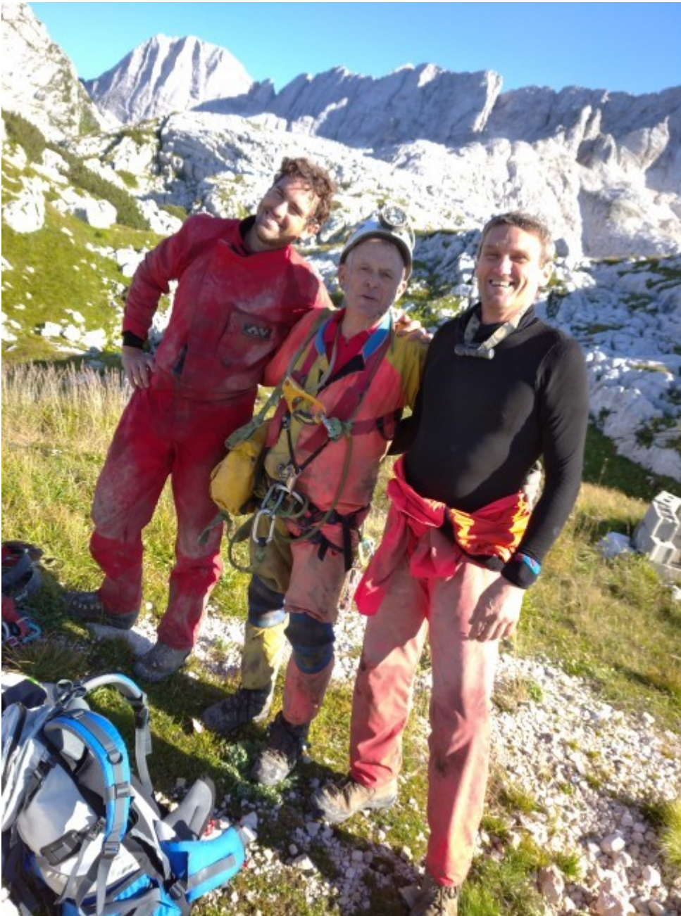
All'uscita dell'abisso Davanzo in Canin pochi giorni prima della tragedia