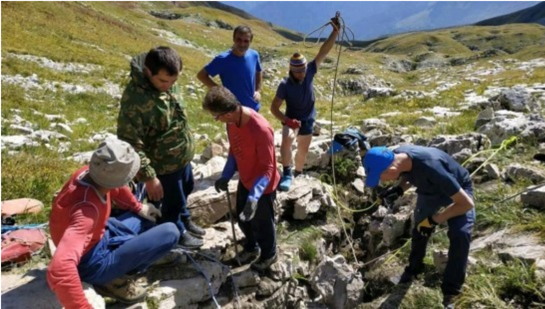
Il Cavex Team fuori dalla grotta per il recupero della barella