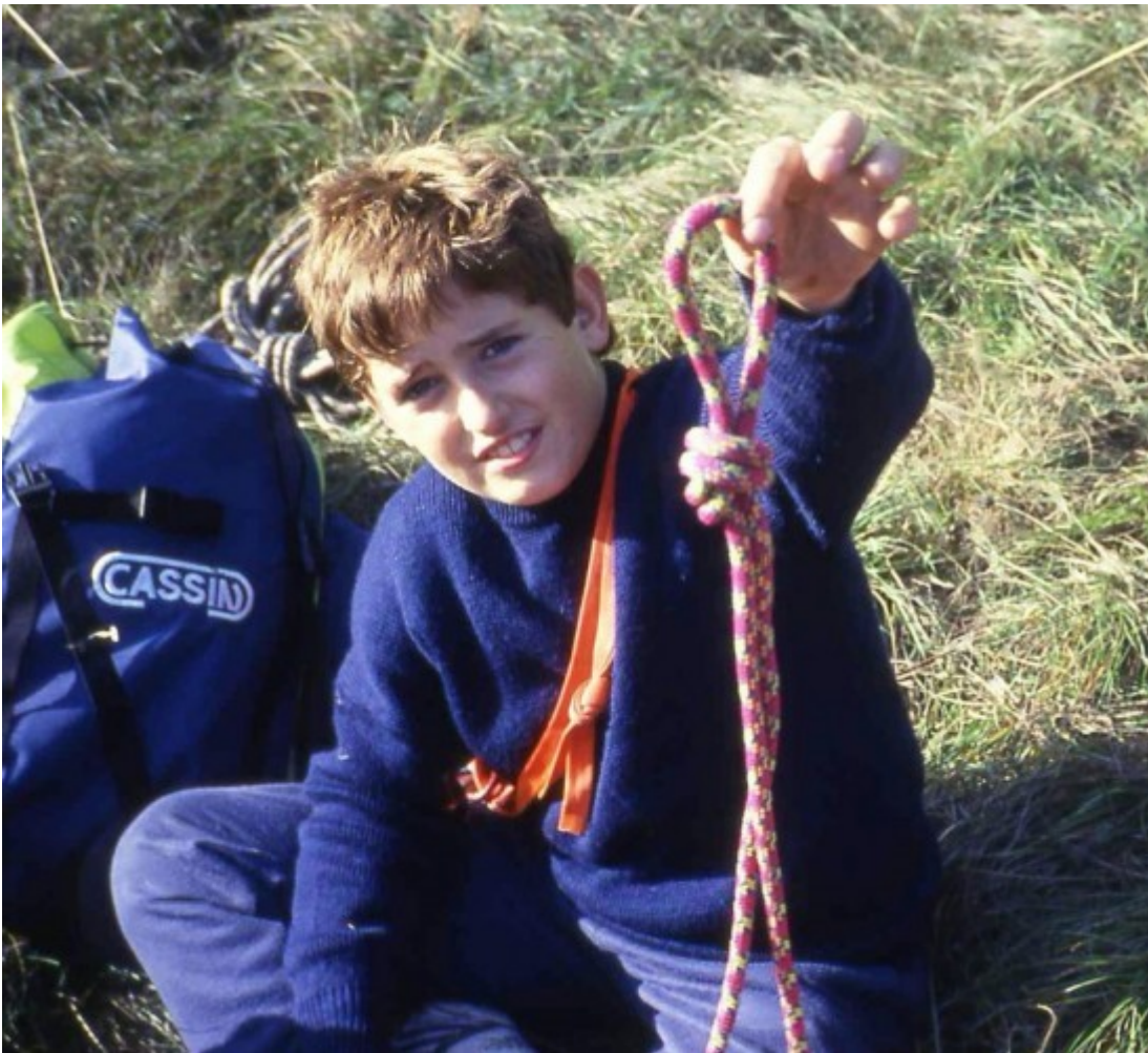
Cresciuto nella grande famiglia della CGEB

In tutti noi rimarrà indelebile il tuo meraviglioso sorriso.